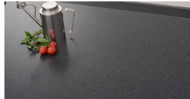
※写真はブラックストーンです。