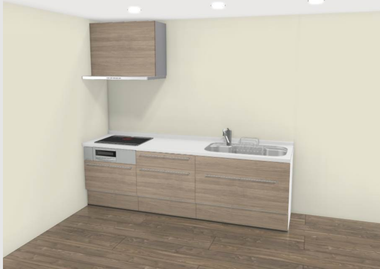
実物を撮影した画像ではないため、実物と異なる場合があります。 見積記載品以外はイメージです。*床名：ウォルナットF(DZ)横・ラシッサD